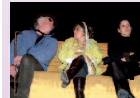
Les acteurs Folioscène en pleine répétition

La troupe Folioscène prépare son prochain spectacle qui se déroulera les 21, 22, 28 et 29 mars 2009 à la Salle Barbara Quatre représentations exceptionnelles ! En première partie, vous rencontrerez Rosy Longues Jambes, Paco le Terrible, Claude François...dans la pièce « Far west » montée par neuf jeunes comédiens de Saint Martin. Ce texte de Cyrille Royer vous emmènera dans un univers absurde et loufoque.