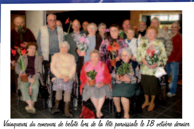
Vainqueurs du concours de belote lors de la fête paroissiale le 18 octobre dernier

Les jeunes qui envisagent une célébration religieuse le jour de leur mariage, sont invités à prendre contact près du presbytère au moins un an avant la date retenue