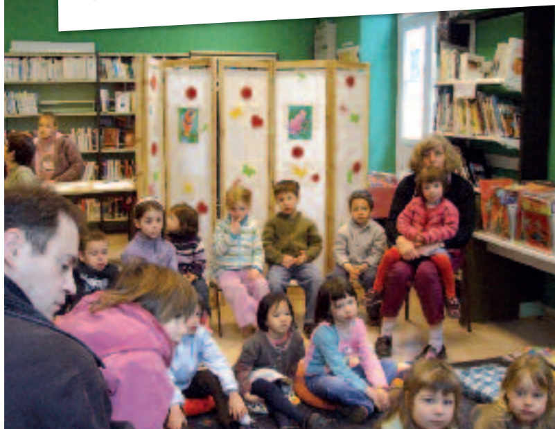
Lecture d'un conte pour les enfants.

Au cœur du village, il est un lieu magique qui a le pouvoir de faire rêver ou voyager, d'instruire ou d'amuser petits et grands !