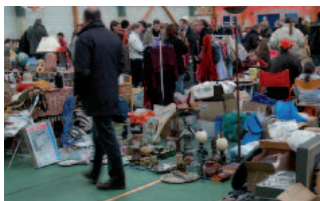
Vide grenier et ateliers créatifs le 30 novembre