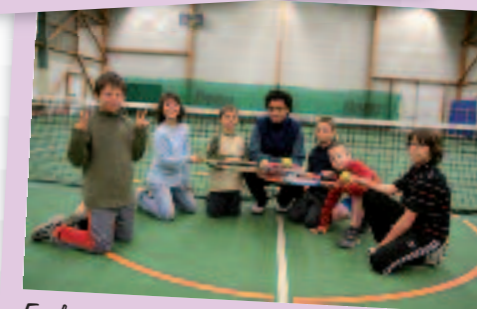
Finalistes du tournoi 2008,

un peu de leur temps pour faire vivre ce club. Les portes d'ailleurs ne sont jamais fermées à qui souhaite donner, ne serait-ce qu'un peu de temps pour les animations.