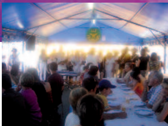
La chorale à la fête Foliosaine