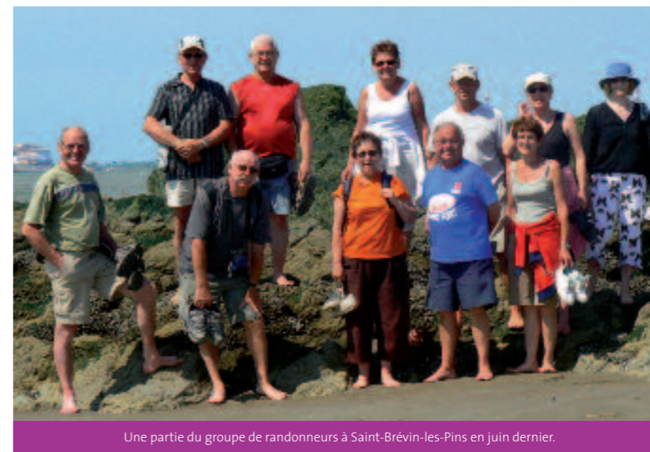
Une partie du groupe de randonneurs à Saint-Brévin-les-Pins en juin dernier.

> Le cinéma : c'est reparti pour une nouvelle saison. Toujours un vendredi sur deux, salle Barbara. Le groupe de bénévoles aurait besoin de s'étoffer : avis aux amateurs. Pendant les vacances de Noël, deux films à l'affiche le vendredi 26 décembre :