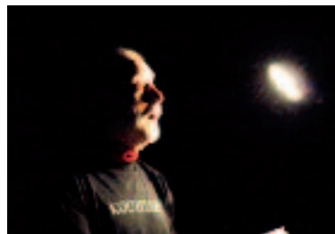
Les Châtaignades en novembre.